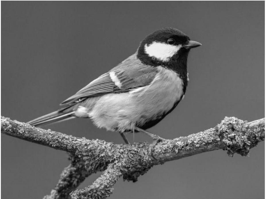
De koolmees, vroege vogel.