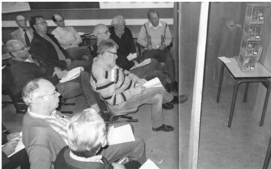
Het gezamenlijk afluisteren van een stam zangkanaries

Het fokken van zangkanaries is één van de oudste takken van de vogelliefhebberij, en daarom klassiek, maar vanwege alle uitdagingen en verrassingen waarvoor de fokker staat zeker geen oubollige vrijetijdsbesteding.